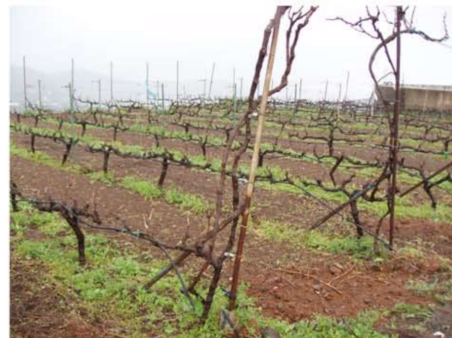
El cuidado de la vid. Bodega La Montaña.