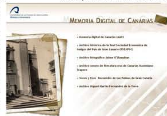
Portal Memoria Digital de Canarias.

ria, el Cabildo de Lanzarote, la Universidad de Lanzarote, la Universidad de La Laguna, la Biblioteca Municipal de Santa Cruz de Teneri-