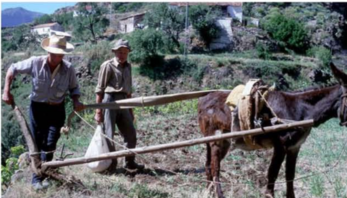
Sembrando un campo con arado y bestia (Cumbre de Gran Canaria)

vacas o bueyes, y se componía de varias partes: la tira, dos camellas, dos correderas y el dibujo de presentación, que junto con otros artilugios artesanales como los frontiles y las collundas se daba forma al enyugado de los animales. La yunta era sujeta para realizar las faenas del arado y revuelto de los campos, trillas y arrastres de cosas pesadas para las fábricas, como piedras u otros utensilios. Aparte de fabricarse en madera de castaños, también se utilizaba el nogal por ser más ligero de peso.