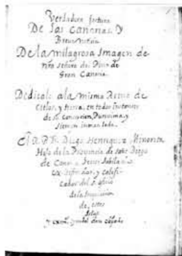
Verdadera fortuna de las Canarias y breue noticia de la milagrosa imagen de Ntra. Señora del Pino de Gran Canaria; dedicado a la misma Reina de los cielos y tierra...

hablan los canarios: refundición del léxico de Gran Canaria, un documento que versa sobre los modismos y vocablos de las islas. Al final contiene un pequeño diccionario, donde se incluyen términos pocos usados destinados a extinguirse en el tiempo.