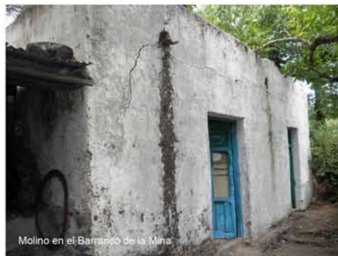
Molino en el Barranco de la Mina