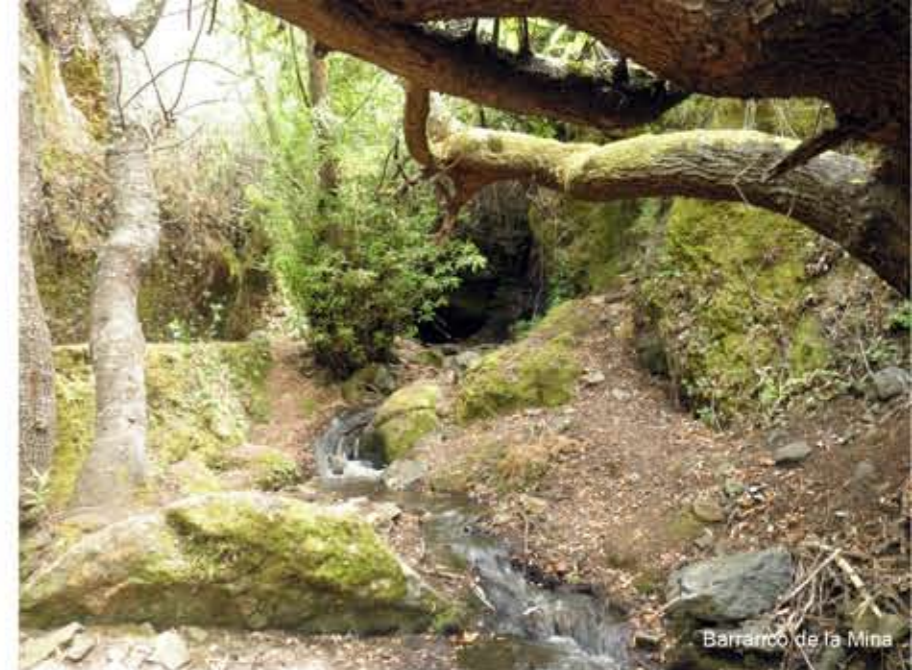
Barranco de la Mina