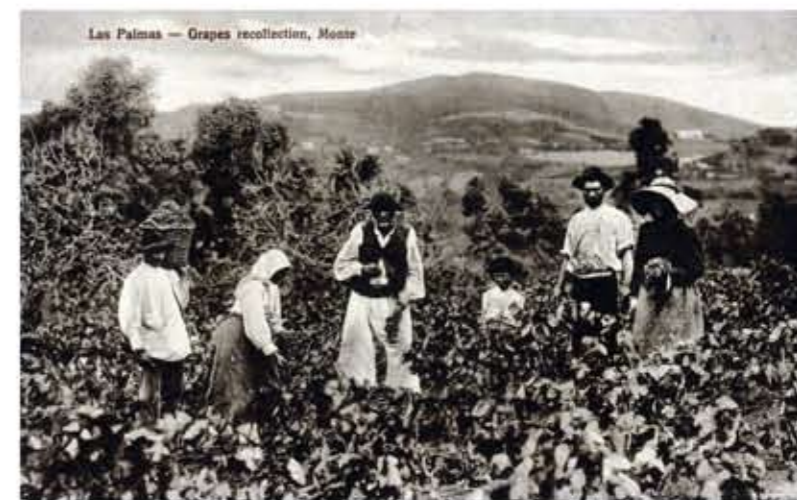
Vendimiando en El Lentiscal.

De la misma manera la autora Naranjo Monzón en sus Vivencias de un pueblo , destaca el uso del vino como acompañamiento a la