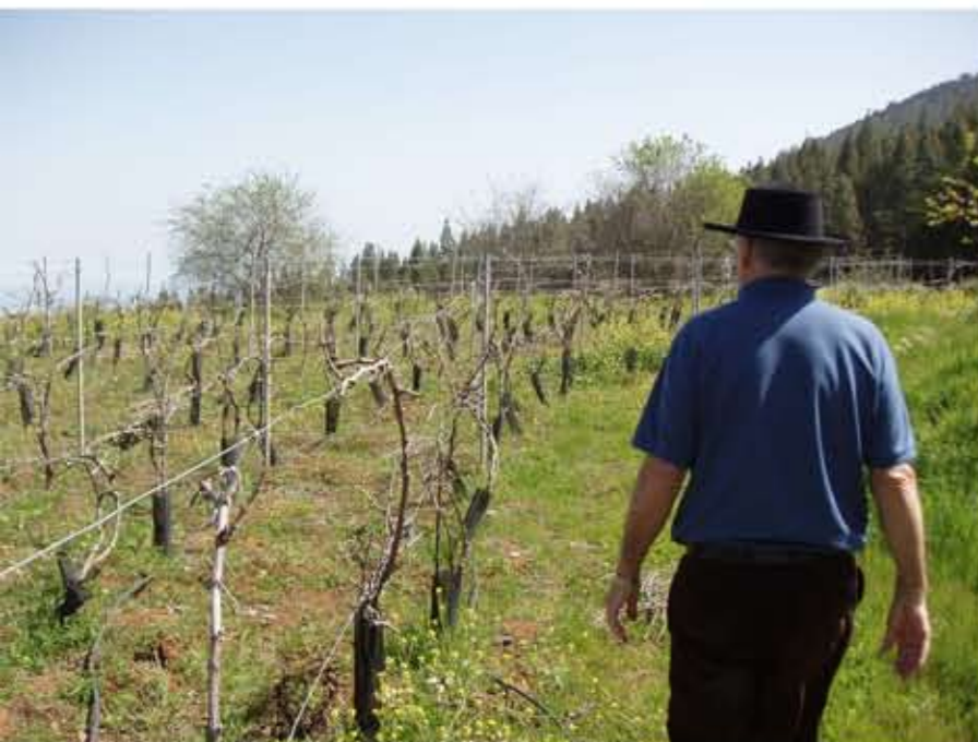
El viticultor en su finca. Bodega Bellandra.

2006:27). Importantes trabas para el vino canario.