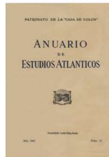
Anuario de Estudios Atlánticos

de Canarias y su marco atlántico. Superado ya el medio siglo de vida, es quizás la publicación periódica de carácter científico más importante de Canarias. No menos importante son los Cuadernos de Botánica Canaria que se convirtió en la primera revista especializada en temas botánicos publicada en Canarias, iniciativa del botánico alemán Günther Kunkel. Desde 1967 hasta 1977 editó desde su finca de Santa Lucía de Tirajana (Gran Canaria) los 28 números de estos Cuadernos, junto con suplementos y monografías, así como la revista Botánica Macaronésica .