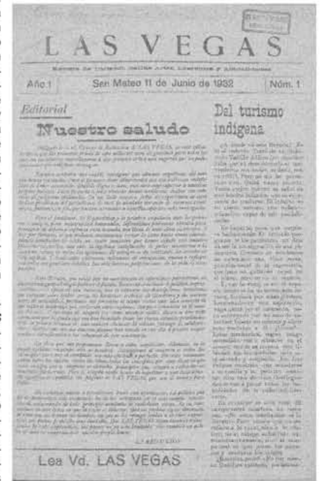
Primer número de LAS VEGAS, 11 de junio de 1932.

La entrevista, de la que a tenor de las preguntas y respuestas se desprende un ambiente relajado, permitió que Kuchenbuch ampliara su opinión sobre el turismo en Canarias, así como que propusiera por qué derroteros debía ir el futuro