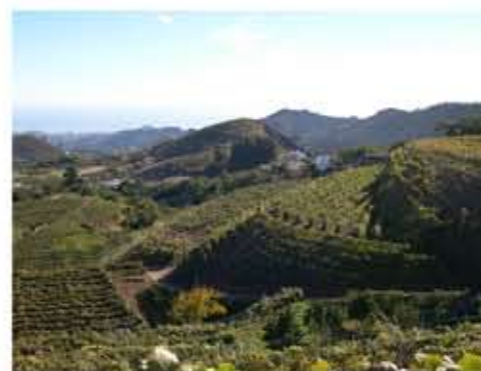
Zonas vitivinícolas en La Lechuza, Bodega Frontón de Oro.