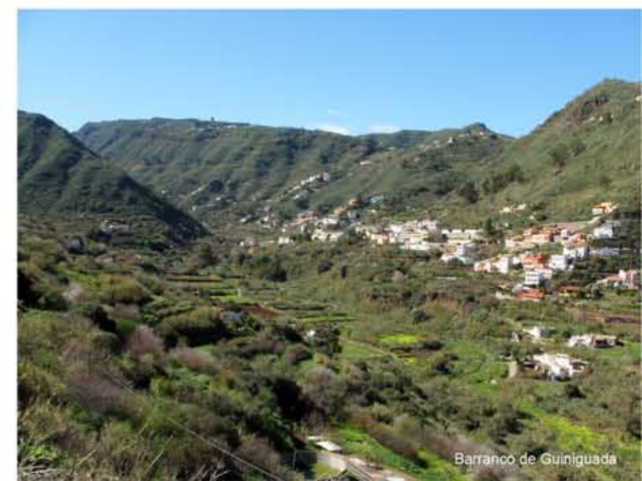
Barranco de Guiniguada