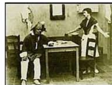
La hija del Mestre

simplemente ver documentales que se emitían en las televisiones públicas cuando los peninsulares se acercaban aquí para filmar nuestra riqueza cultural, etnográfica y paisajística siguiendo el boom del turismo, ejemplo de ello es algún que otro episodio de programas como "Nuestras Islas" o "Memoria de nuestras Islas".