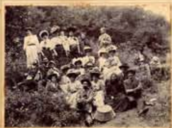
Excursión familiar a Hoya Bravo. Comienzos del siglo XX.

sión en coche realizada por unos cincuenta jóvenes a los parajes de la Cumbre que, saliendo desde el Madroñal, llegaron hasta el municipio cumbre. El relato detalla el paso por distintos parajes de los que el autor destaca la presencia de amarillos triguales con sus doradas espigas, el tupido bosque de almendros, los nogales, castaños y pinos, la marcada orografía, las múltiples aguas que discurrían por las vertientes, las imágenes del Teide y el Roque Nublo, las cuevas de Cuevas Caidas (en ellas relata que los visitantes encontraron vestigios aborígenes como cerámica y utensilios), la vestimenta y maneras de la población local y las viviendas del siglo XVIII que se encontraban en Tejada, con sus huertas de almendro y vid.