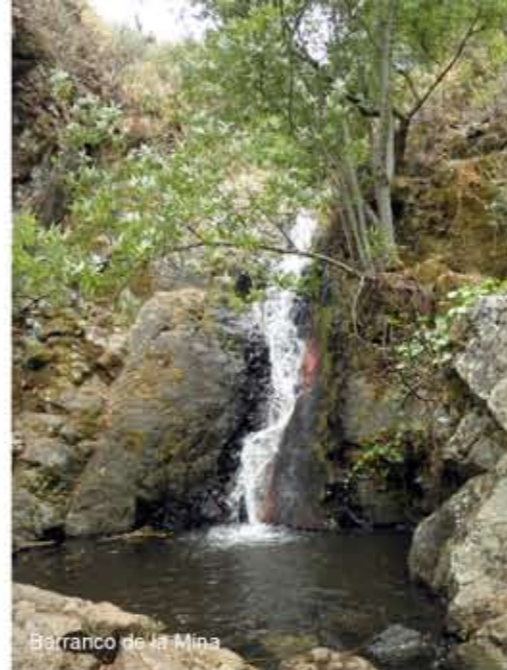
Barranco de la Mina