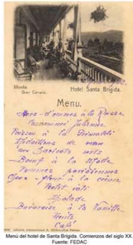
Menú del hotel de Santa Brigida. Comienzos del siglo XX.

del segundo número de LAS VEGAS, abarcando el asunto bajo el título Hacia una actividad turística . Este texto argumentaba que la revista era uno de los medios para trasladar a todos los rincones de Gran Canaria y del Archipiélago que la demanda del turismo, como vía de desarrollo en Canarias, debía ocupar todos los órdenes de la política insular 9 .